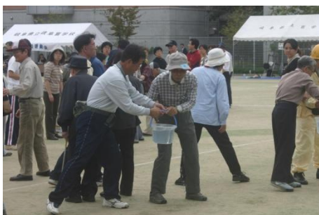
見えなくても手渡しできます！

これもビニール袋での消火競争と並び火災を想定したものである。消防車が車での間、地域として協力し何ができるか、何が必要か、を様々な角度から考える。たとえば水の確保、人員の確保、水を手渡す容器の確保などである。