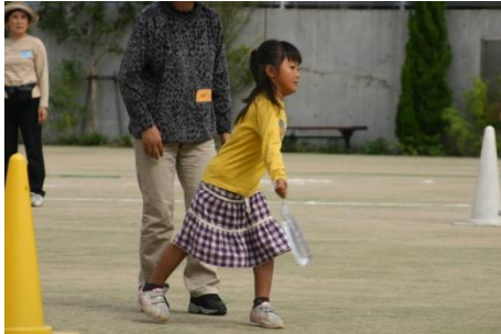
なかなか難しかった

初期消火の大切さや、火災による被害を食い止める必要性を実感し、今後の対応を考える理解が得られた。