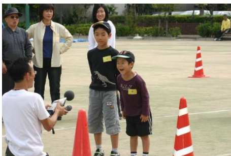
地域の子供たちも