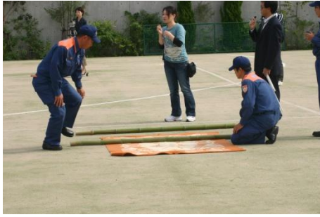
中消防署員による簡易担架の作り方模範指導