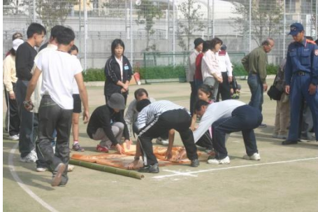
各チームの様子 1チームに一人チェックする署員が配置