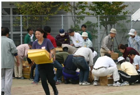
あわてず確実にみんなと一緒に

備蓄の必要性とその食材を検討するいい材料となる。温かい食べ物であり、万人が食することのできるメニューなどを構成し保存する必要がある。